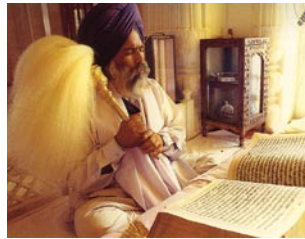
Un Sikh lisant le Gourou Granth Sahib, et tenant un éventail royale majestueusement agitée sur le texte sacré comme rappel de la révélation souveraine de Dieu.

Les Gourous Sikhs basent leurs enseignements sur une révélation de Dieu, qui forme la base du Gourou Granth Sahib, le texte sacré Sikh. Les enseignements du Gourou Granth Sahib, sous forme de la poésie divine, s'accordent à un système formel de la musique classique Sikh. Les hymnes du Gourou Granth Sahib définissent les règles d'une vie harmonieuse. Dans la compilation du texte sacré Sikh, les Gourous ont inclus des hymnes de nombreux guides spirituels non Sikhs appartenants à des traditions religieuses diverses, ce qui donne une dimension vraiment universelle au Gourou Granth Sahib.