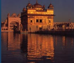
Darbar Sahib, aussi connu comme le Temple Doré, se trouve à Amritsar, Punjab. C'est la capitale théologique et politique des Sikhs.